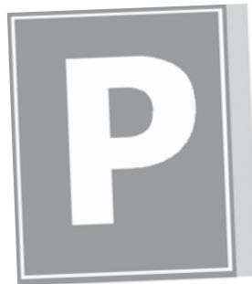
INFORMATIE (RECHTHOEKIG OF VIERKANT)